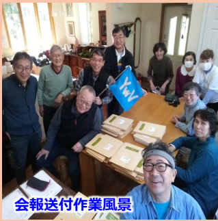
会報送付作業風景

横浜国大ワンダーフォーゲル部 (YVV)は1957年創部で70年を迎えつつあります。OB活動としては、OB山行、妙高高原にある山小屋活動、会報・メルマガの発行、部史編集活動、ホームページの運営などシームレスで愉快的活動をしています。どうぞ横国Dayで開催する山の展示会に、お立ち寄りください。